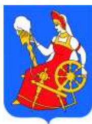
Рис. 2. Герб города Иваново

На все иллюстрации в тексте должны быть даны ссылки.